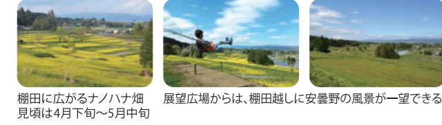
棚田に広がるソノバナ畑 展望広場からは、棚田越しに安曇野の風景が一望できる見頃は4月下旬～5月中旬

安曇野の風景を象徴するソノバナやナノハナなど、季節の花を楽しめます。最上部の展望広場からは、季節の花越しに安曇野の風景が一望できます。