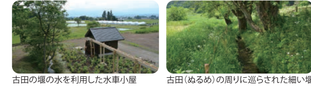
古田の堰の水を利用した水車小屋 古田(ぬるめ)の周りに巡らされた細い堰