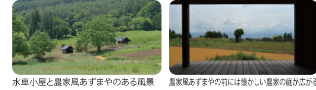
水車小屋と農家風あずまやのある風景 農家風あずまやの前には懐かしい農家の庭が広がる

「おひさま」の風景を彷彿とさせる水車小屋や農家風あずまやがあり、昔懐かしい昭和30年代の安曇野の田園風景を再生しています。