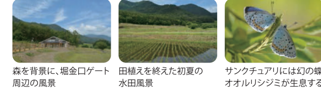
森を背景に、堀金口ゲート周辺の風景 田植えを終えた初夏の水田風景 サンクチュアリには幻の蝶オオルリジミが生息する

古田(ぬるめ)の田園風景や、全国でも珍しい希少な蝶・オオルリジミが生息するサンクチュアリがあり、昔ながらの農作業や自然観察などを体験・学習できます。