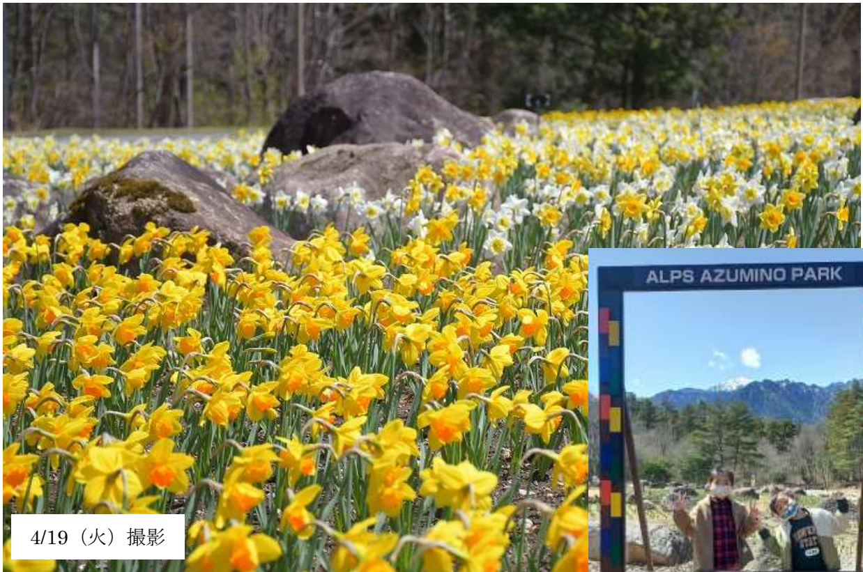
4/19 (火) 撮影

今年は暖かい日が続き、「れき原の花畑」に植栽した約9万球の“スイセンとムスカリ”が、早くも見ごろを迎えています。44品種のスイセンは、種類を変え5月上旬ごろまでは楽しませてくれそうです。また、今年から、皆様にお楽しみいただけるフォトスポットとして、スイセン花畑や残雪の北アルプス（餓鬼岳）を背景にしたフォトフレームを設置しました。今の時期にしか撮ることのできない景色をお楽しみください。