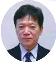
あづみの公園早春賦音楽祭 実行委員会 実行委員長 アルプスあづみの公園 管理センター長